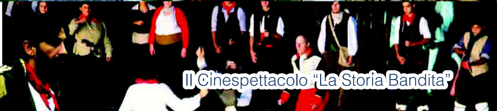
Il Cinespettacolo "La Storia Bandita"