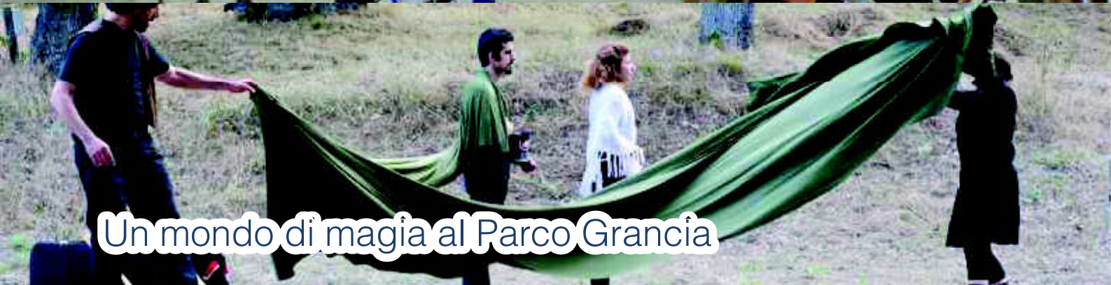
Un mondo di magia al Parco Grancia