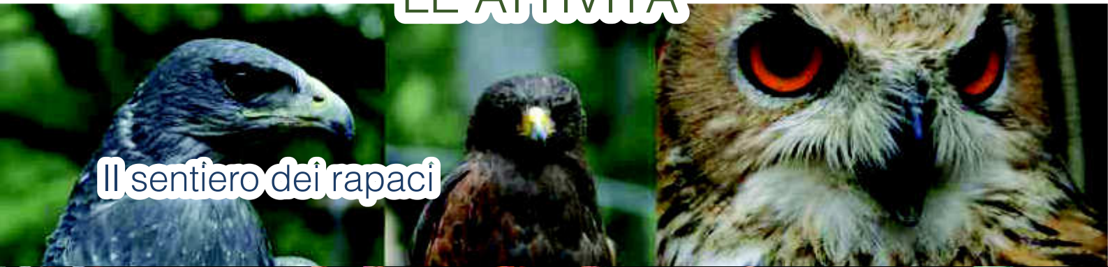
Il sentiero dei rapaci