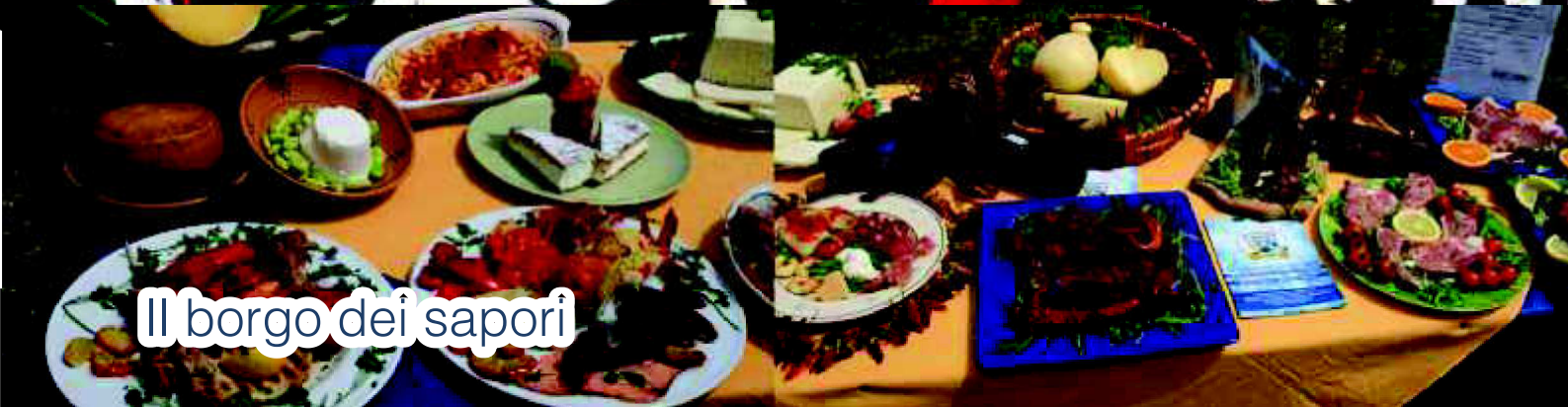
Il borgo dei sapori